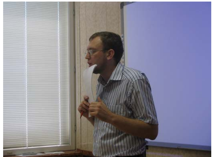
Практические занятия. Аналитический центр МГУ им. М.В. Ломоносова