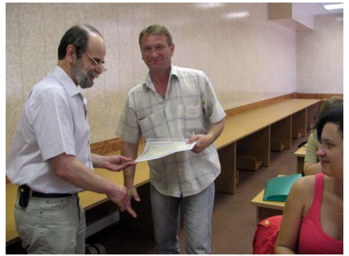
Завершение работы семинара