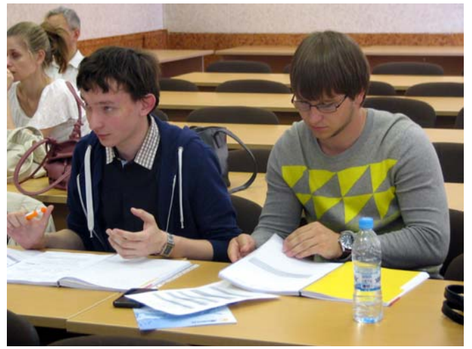
Вопросы и обсуждение