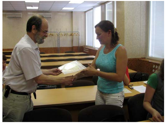
ЗАВЕРШЕНИЕ РАБОТЫ СЕМИНАРА